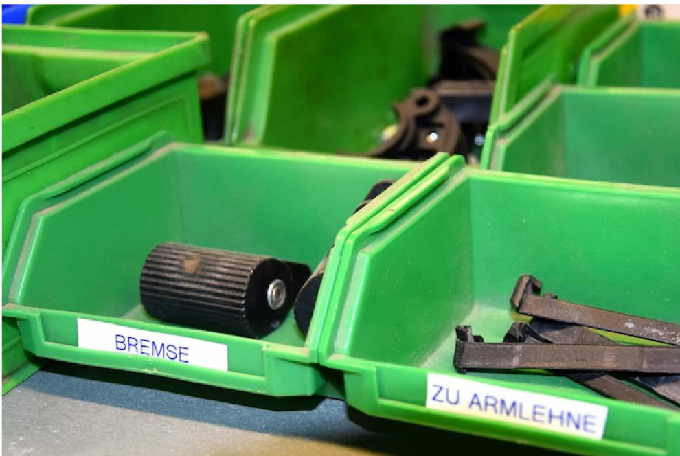
Ein grosses Ersatzteillager hat sich bereits angesammelt.

Das Projekt Rollaid verbindet Berufsintegration, humanitäre Hilfe und Recycling, so werden aus der ganzen Schweiz jährlich bis zu tausend Rollstühle und Ersatzteile gesammelt und in die Werkstatt in Interlaken zur Instandstellung transportiert.