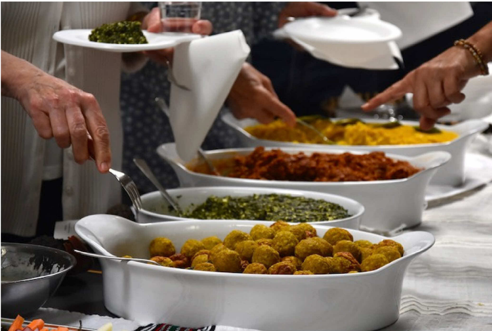
Der Catering Service Injera, ein äthiopisches Restaurant aus Bern, verköstigte die Besucher.